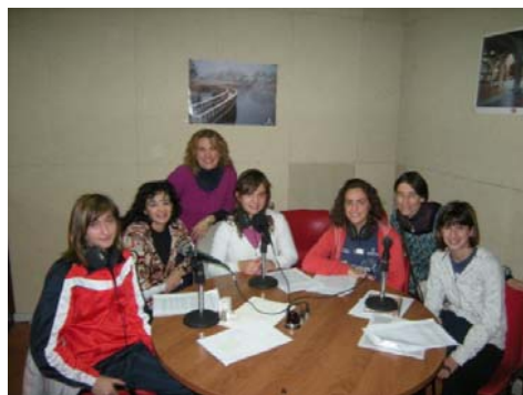
Alumnas colaboradoras junto con las profesoras acompañantes y la presentadora del programa radiofónico en Infantes FM

Durante el mes de noviembre ya se han emitido 3 programas, que bajo el título "NUESTRA VOZ EN LAS ONDAS", hacen llegar a los oyentes las inquietudes de los alumnos/as, a la vez que informan sobre las actividades que tienen lugar en el centro, todo