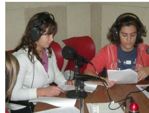
Alumnas de 3º ESO durante la retransmisión de uno de los programas radiofónicos en Infantes FM.

Esperamos que con el tiempo ésta se convierta en una cita ineludible para muchos oyentes de Infantes y la comarca, y que todos/as tengáis la oportunidad de escuchar a vuestros hijos/as en las ondas.